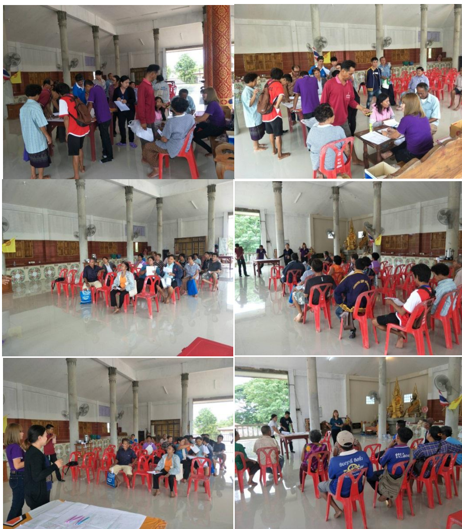
รูปที่ 2.1 ภาพประกอบการทำบันทึกยินยอมให้ใช้ที่ดิน

การประชุมเจ้าของที่ดิน ในเขตโครงการส่งน้ำและบำรุงรักษาเขื่อนแควน้อยบำรุงแดน ส่วนที่ 23 ตำบลท้อแท้ ตำบลวัดโบสถ์ อำเภอบึงสามพัน จังหวัดพิษณุโลกเพื่อสอบถามความสมัครใจในการดำเนินการจัดรูปที่ดิน จัดทำบันทึกแสดงความยินยอม/ไม่ยินยอมในการจัดรูปที่ดินของเจ้าของที่ดินในเขตโครงการจัดรูปที่ดิน และจัดระบบน้ำเพื่อเกษตรกรรมที่ 4 ตามพระราชบัญญัติจัดรูปที่ดินเพื่อเกษตรกรรม พ.ศ.2558