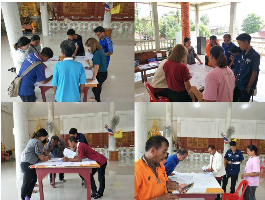
รูปที่ 2.2 ภาพประกอบการประชุมชี้แจงแบบเบื้องต้น

วันที่ 13-15 มิถุนายน 2561 เจ้าหน้าที่สำนักงานจัดรูปที่ดินและจัดระบบน้ำเพื่อเกษตรกรรมที่ 4 ร่วมกับคณะกรรมการจัดรูปที่ดินชุมชนพิจารณาแผนผังโครงการจัดรูปที่ดินเบื้องต้น และดำเนินการปรับปรุงแผนผังโครงการจัดรูปที่ดินให้เป็นไปตามความต้องการของคณะกรรมการจัดรูปที่ดินชุมชนและเป็นประโยชน์ต่อการทำเกษตรกรรมโดยให้คณะกรรมการจัดรูปที่ดินชุมชนสอบถามความคิดเห็นจากเจ้าของที่ดินในเขตแผนผังโครงการจัดรูปที่ดิน