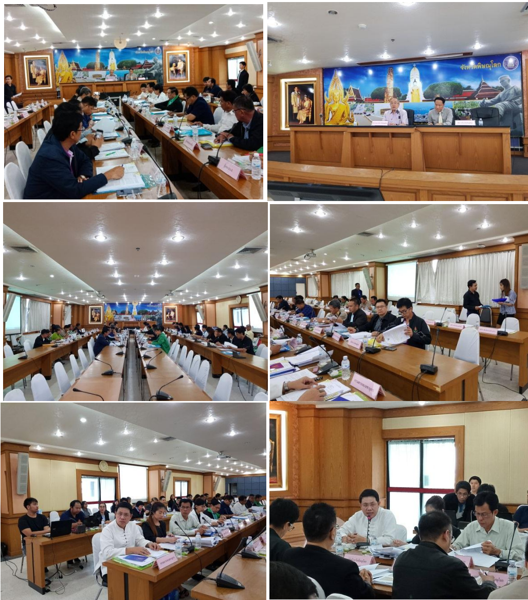
รูปที่ 2.4 ภาพการประชุม คจจ. อนุมัติแผนผังจัดรูปที่ดิน