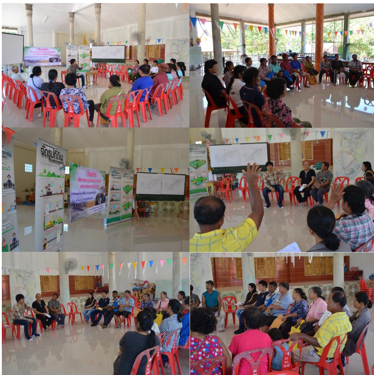
รูปที่ 2.5 ภาพการดำเนินการมีส่วนร่วมของประชาชน ระหว่างก่อสร้าง