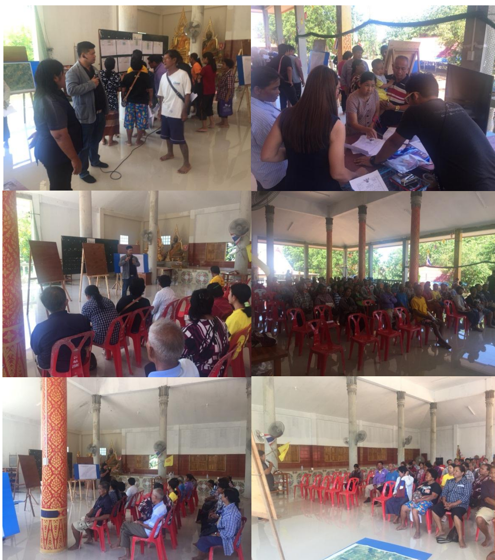
รูปที่ 2.3 ภาพประกอบการคัดเลือกคณะกรรมการจัดรูปที่ดินชุมชน

คณะกรรมการจัดรูปที่ดินชุมชนมีหน้าที่พิจารณาแผนผังโครงการจัดรูปที่ดินเบื้องต้นร่วมกับพนักงานเจ้าหน้าที่สำนักงานจัดรูปที่ดินและจัดระบบน้ำเพื่อเกษตรกรรมที่ 4 และดำเนินการปรับปรุงแผนผังโครงการจัดรูปที่ดินให้เป็นไปตามความต้องการของคณะกรรมการจัดรูปที่ดินชุมชนและเป็นประโยชน์ต่อการทำเกษตรกรรมโดยให้คณะกรรมการจัดรูปที่ดินชุมชนสอบถามความคิดเห็นจากเจ้าของที่ดินในเขตแผนผังโครงการจัดรูปที่ดินเบื้องต้นด้วย เจ้าหน้าที่สำนักงานจัดรูปที่ดินจังหวัดสกลนครมีหน้าที่ให้คำแนะนำ ชี้แจงข้อมูล และเสนอแนะวิธีการจัดทำผังที่ดิน ระบบชลประทาน ถนนหรือทางลำเลียงในไร่นา และสาธารณูปโภคอื่นในโครงการจัดรูปที่ดิน และจัดทำแผนผังโครงการจัดรูปที่ดิน โดยคำนึงถึงข้อเสนอนแนะของคณะกรรมการจัดรูปที่ดินชุมชน